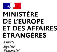
MINISTÈRE DE L'EUROPE ET DES AFFAIRES ÉTRANGÈRES