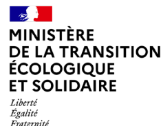
MINISTÈRE DE LA TRANSITION ÉCOLOGIQUE ET SOLIDAIRE